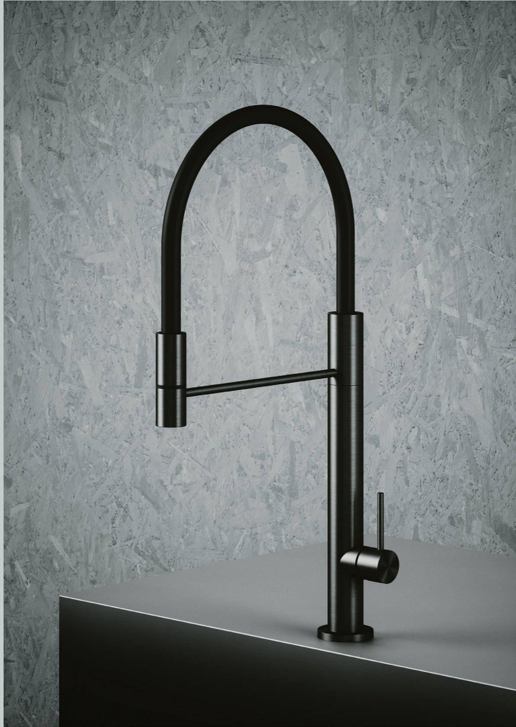
3980N PVD Black Gold